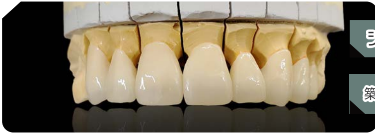
ジルコニアクラウン