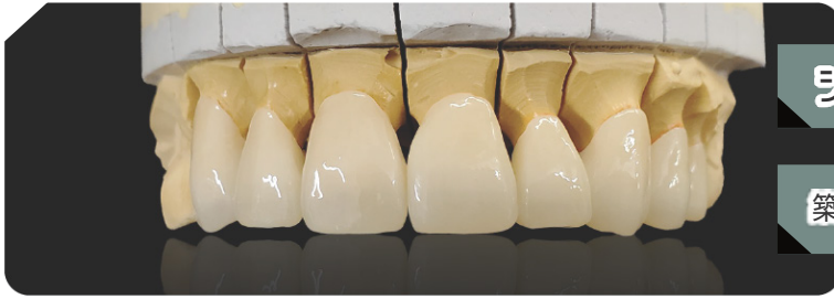
ジルコニアクラウン